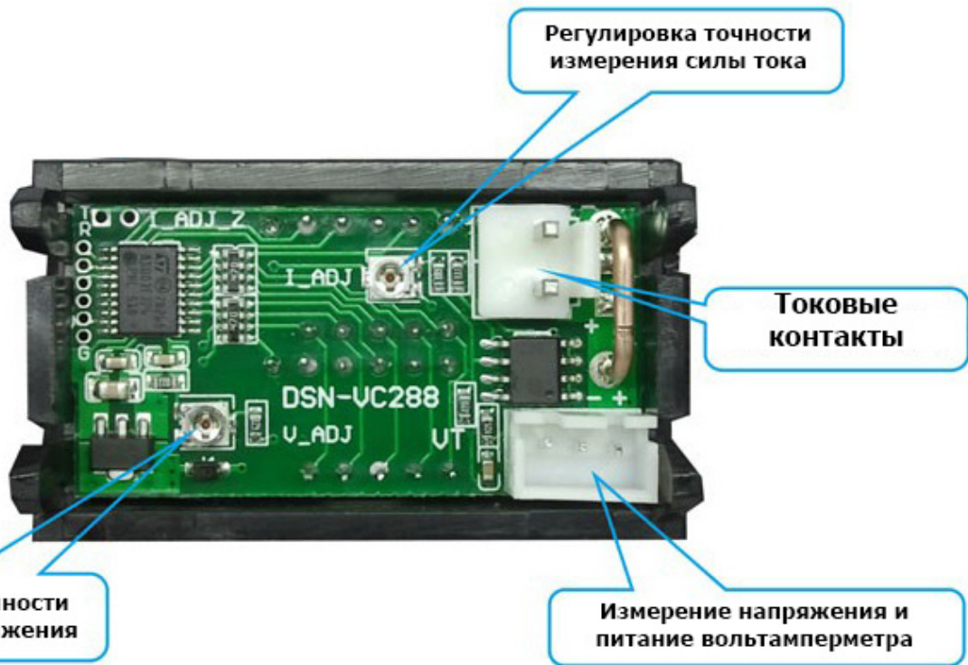
Схема подключения с измеряемым напряжением 4-28В и силой тока до 10А