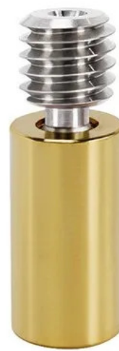
Titanium alloy brass throat