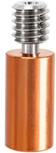
Titanium alloy red copper throat