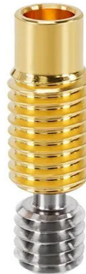
Titanium alloy brass throat