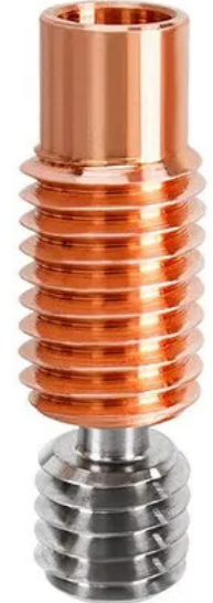
Titanium alloy red copper throat