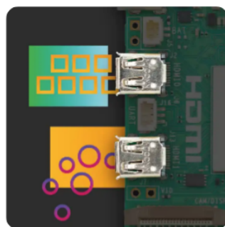
Цифровые 4Кр60 HDMI аудио/видеовыходы