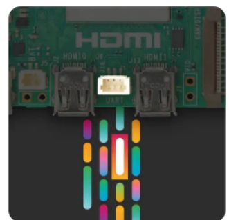
Отладочный UART порт